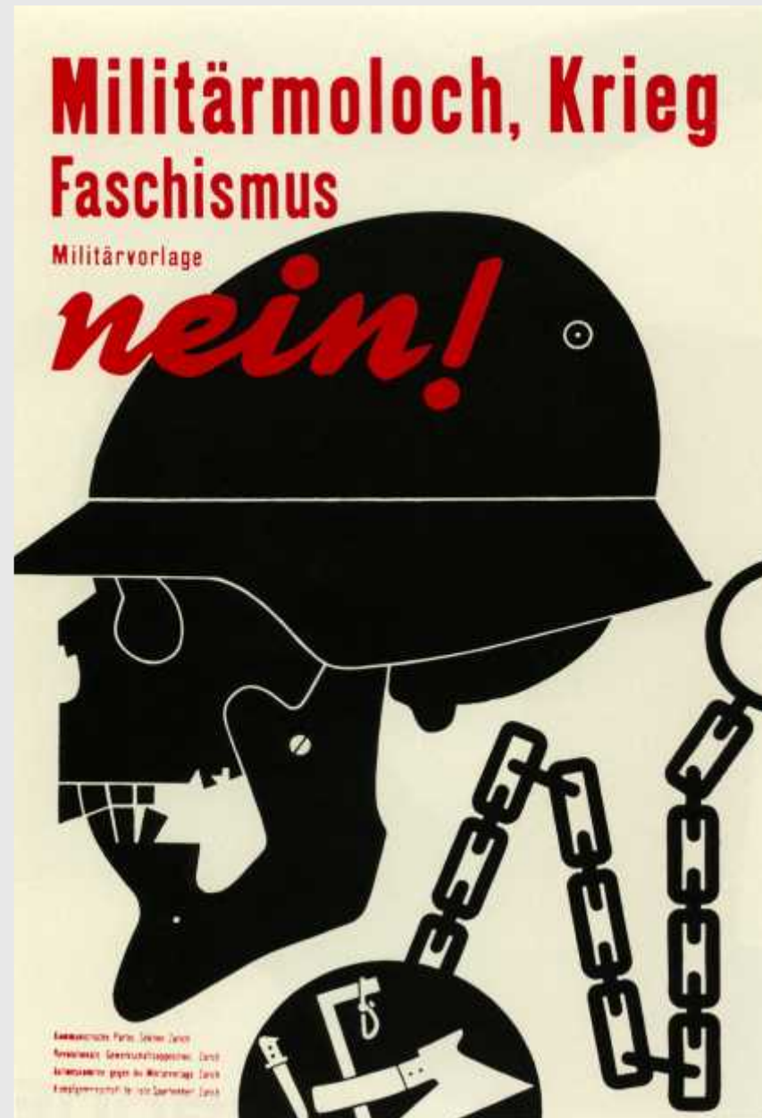
Theo Ballmer Abstimmungsplakat gegen Militärvorlage

Die Kommunistische Partei der Schweiz. Von der Zimmerwalder Linken bis zum Verbot der KPS im Jahre 1940.