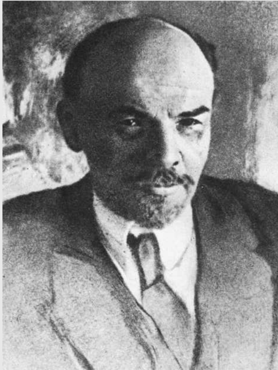
Lenin Wladimir Iljitsch Uljanow

Die Kommunistische Partei der Schweiz. Von der Zimmerwalder Linken bis zum Verbot der KPS im Jahre 1940.